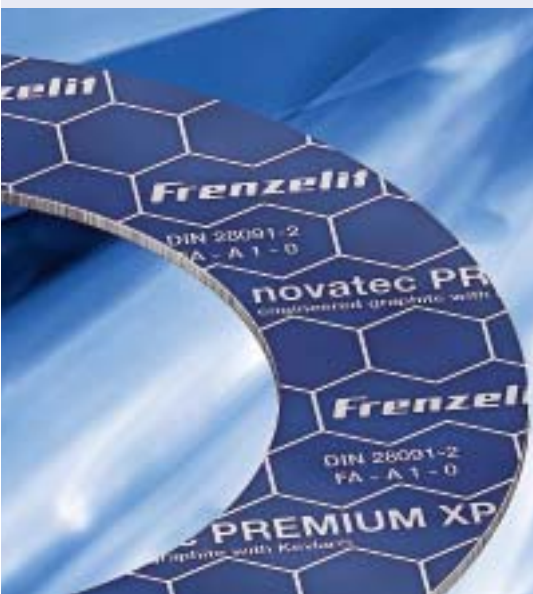
Novatec premium XP ist bis ca. 300 °C nahezu universell einsetzbar

tigung kommt eine ausgeklügelte Verfahrenstechnik zum Einsatz. Zudem wird eine spezielle Graphitstruktur aus Plättchen und Körnern in einem definierten Mischungsverhältnis verwendet. Bei identischen mechanischen Kennwerten wird so mit dem weiterentwickelten Dichtungswerkstoff eine um den Faktor 10 geringere Leckagerate erreicht. Die Grafik zeigt einen Leckagevergleich bei 25 bar Innendruck. Die Dichtungskennwerte nach DIN EN 13555 von Novatec Premium XP ermöglichen sinnvolle