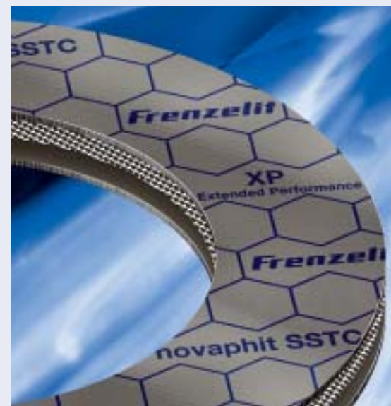
Novaphit XP zeichnet sich durch einen verbesserten Oxidationsschutz und eine temperaturbeständige Antihafwirkung aus

Bei der Auswahl von Dichtungen sind Kennwerte nach DIN EN 13555, wie die Mindestflächenpressung im Einbau- und Betriebszustand, Q min und Q smin für eine vorgegebene Dichtheitsklasse oder der PQR-Wert, der die Relaxation unter Temperatur und Belastung beschreibt, ein wichtiges Kriterium. Die Leistungsfähigkeit des Dichtungswerkstoffes bemisst sich jedoch auch in ihrem Langzeitverhalten. Hier eröffnet die XP-Generation Graphitdichtungen aufgrund ihrer Oxidationsstabilität neue Möglichkeiten. Sie hilft nicht nur einen langjährigen sicheren Anlagenbetrieb zu bewerkstelligen. Sie trägt auch über einen einfachen, rückstandsreifen Dichtungsaustausch dazu bei, den Instandhaltungsaufwand zu senken und Stillstandzeiten möglichst kurz zu halten. Die XP-Technologie wird sowohl für die Graphitdichtung mit einer Edelstahlstreckmetalleinlage (Novaphit SSTC XP) als auch für