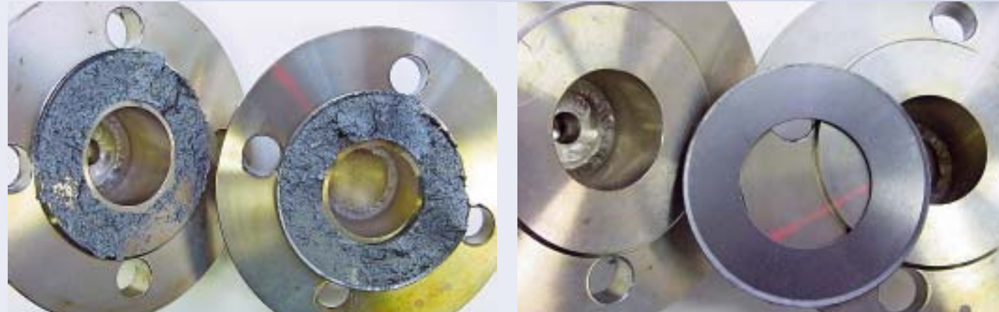
Haftversuch ohne XP (li.): Graphitanhaftung am Flansch nach 24 h bei 300 °C, Haftversuch mit XP (re.): Novaphit SSTC XP zeigt auch nach 24 h bei 300 °C keine Anhaftung am Flansch

Dichtungswerkstoff schlägt eine Brücke zwischen reinen Elastomerdichtungen und kautschukgebundenen Faserstoffdichtungen. Die Anpassungsfähigkeit liegt nahezu auf dem Niveau einer üblichen Gummidichtung. Dabei sind die mechanischen Eigenschaften des Dichtungswerkstoffes vor allem unter Tem-